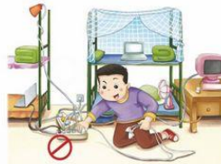
正确使用电器设备,不乱接电线