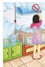
经常检查天然气管等家庭火灾隐患