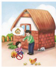
告诉儿童玩火的危害,教育儿童不玩火