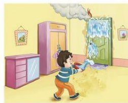
大火封门无法逃生时，可用浸湿的毛巾、衣物堵塞门缝泼水降温