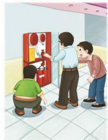
单位配备必要的消防器材