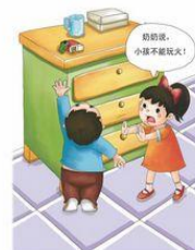
打火机,火柴等物品放在儿童拿不到的地方