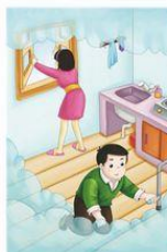
发现燃气泄漏,速关阀门,打开门窗